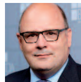
Im Talk mit Kai Diekmann: Steffen Kampeter

Kai Diekmann (Jg. 1964) ist einer der profiliertesten Journalisten des Landes und vielen als Chef der BILD bekannt, deren Chefredakteur er von 2001 bis 2015 war. Er war damals enger Begleiter von Bundeskanzler Helmut Kohl. Heute ist Diekmann ein „Rockstar“ in den Talkrunden, bekannt dafür, die Dinge „quergebürstet“ und „ungeschminkt“ auf den Punkt zu bringen. Inzwischen hat er den konventionellen Journalismus hinter sich gelassen. Als Unternehmens- und Kommunikationsberater ist Diekmann für viele Dax-Unternehmen, aber auch für den klassischen Mittelstand tätig. Darüber hinaus kümmert er sich um neue Projekte: Den „Zukunftsfonds“, die Content-Plattform „Zaster“ und die Social-Media-Agentur „Storymachine“. Aus der Sicht eines Mannes, der „Vieles gesehen hat“, und der die Digitalisierung mitgestaltet, wird er im Talk mit Steffen Kampeter gesellschaftliche Trends analysieren und unsere Zukunft beschreiben.