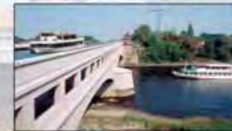
Das berühmte Wasserstraßenkreuz in Minden

Mindener Fahrgastschiffahrt GmbH & Co. KG An der Schachtschleuse 32425 Minden