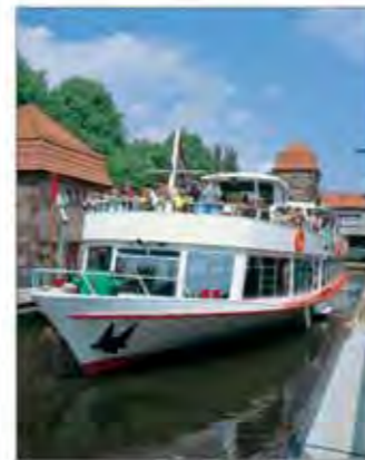
Eine Fahrt durch die Schachtschleuse dürfen Sie sich nicht entgehen lassen!

Wer Minden besucht, muss das weltweit bedeutendste Wasserstraßenkreuz gesehen haben! Auf unseren Fahrten zeigen und erklären wir Ihnen das Wasserstraßenkreuz mit Schachtschleuse, Pumpwerk, Kanalbrücke und Südbstieg. Sie erleben eine Schleusenfahrt mit 13 m Höhendifferenz.